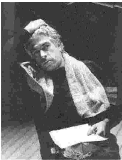
Giorgio Strehler, foto del 1980