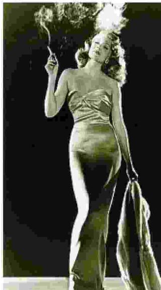
Rita Hayworth a Roma