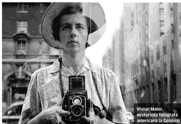
Vivian Maier, misteriosa fotografa americana (a Genova)